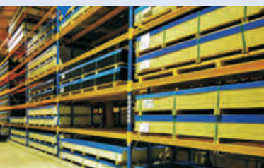
Stock de formatos estándar