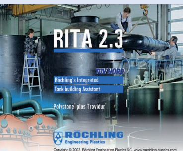
Röchling's Integrated Tank building Assistant