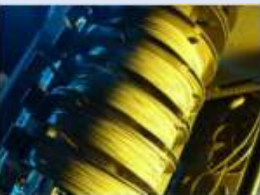
Varilla de soldar en carretes