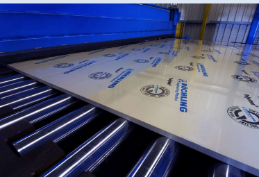
Polystone® P-Gris (Homo) extrusión